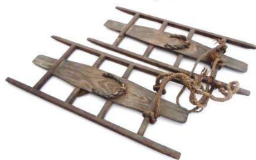
田下駄 田ではくはきもの。