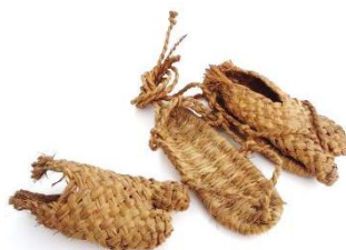
爪掛けつき草鞋 (つまかけつきわらじ) 雪の日はきもの。