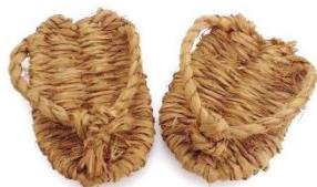
足半草履 (あしなかぞうり) 長さが半分の草履。

本企画展では、芸北地方のただ中に位置する北広島町で使用されてきた様々なはきものを展示し、むかしの足元の工夫や、はきものにみられる芸北の地域性をご紹介します。