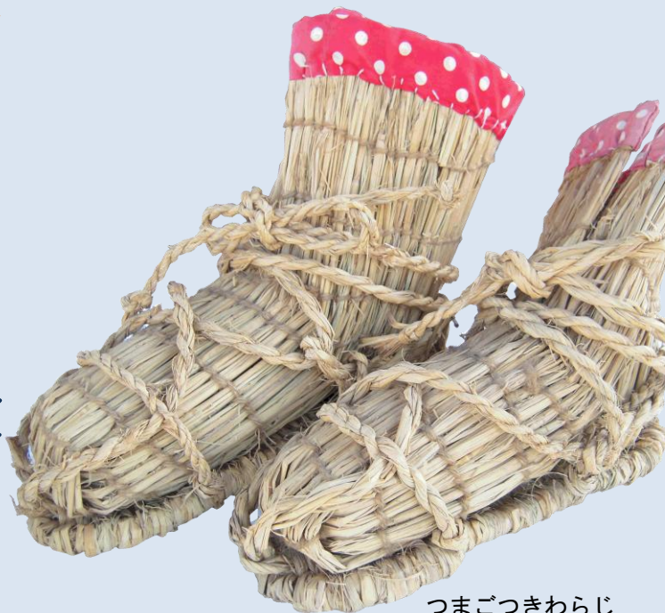
つまごつきわらじ

開館時間 午前9時～午後4時30分 休館日 月曜日（月曜日が祝日の場合はその翌日） 年末年始（12月28日～1月4日） 入館料 上記の企画展示中は無料