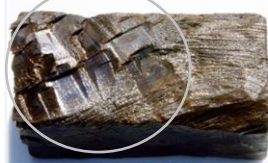
右: 手斧の痕 (吉川元春館跡出土)