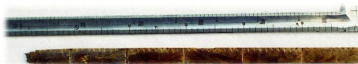
裏目物差し (万徳院跡出土)