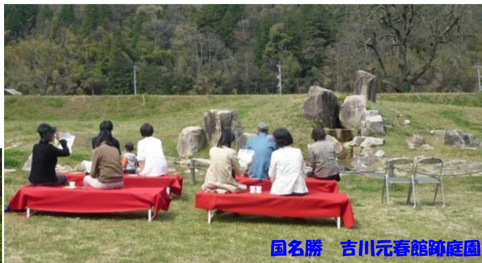
国名勝 吉川元春館跡庭園

② 吉川元春館跡(北広島町海応寺) 昔の遊び、石臼体験、ほたるかご作り体験会有 両会場とも参加無料・お茶の接待有 戦国の庭 歴史館は入館無料